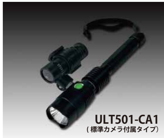
ULT501-CA1 (標準カメラ付属タイプ)