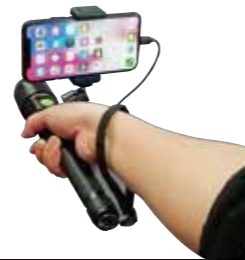
ULT501-SH (スマホホルダータイプ)

LED : 10W COB LED (800lm) 充電電源 : AC100 ~ 240V 50/60Hz 充電時間 : 5.5 ~ 6 時間 (充電中可使用可能) 点灯時間 : 約 2 時間 (100%) 約 6 時間 (50%) 内蔵電池 : リチウムイオン 3.7V 4000mAh 防水規格 : IP54 (雨の中でも使用可能) 入力 : 5V-1A 出力 : 5V-1A 重量 : 363g 本体サイズ : H270×W47×D47 mm 付属品 : AC100V 充電器・USB ケーブル