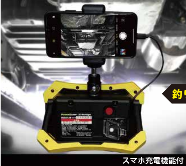
スマホ充電機能付